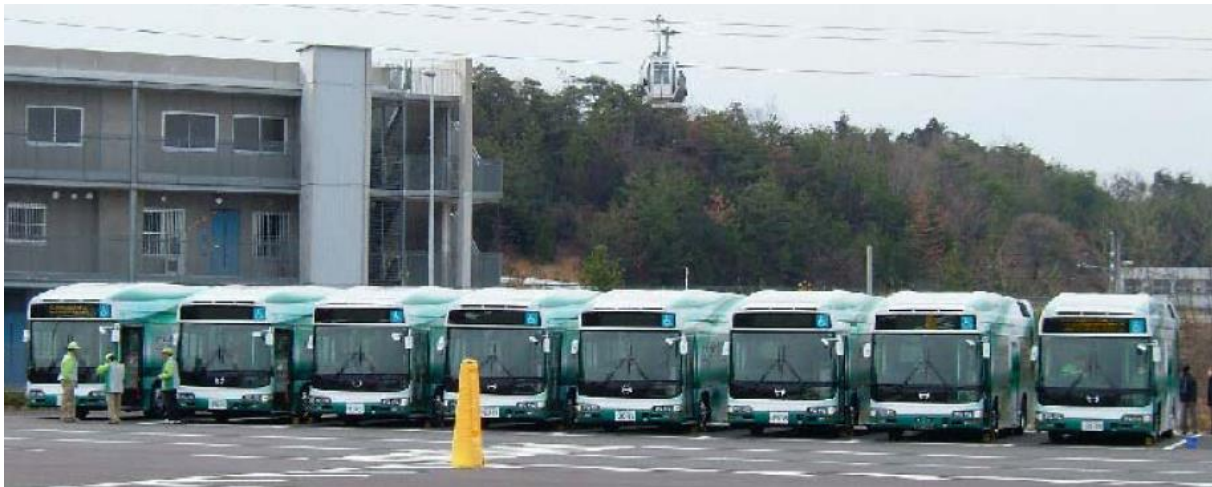
Figure 4 – Les huit bus mis en service à l'EXPO 2005

- En août 2003, un troisième bus, du même type, a été livré au Tokyo Metropolitan Government . De mars 2005 à septembre 2005, huit bus ont été mis en service régulier à l'occasion de l'EXPO d'Aichi (Fig. 4). Ils ont transporté environ 1 million de visiteurs et parcouru près de 125 000 km. La station service installée à proximité délivrait de l'hydrogène produit par reformage de gaz naturel.