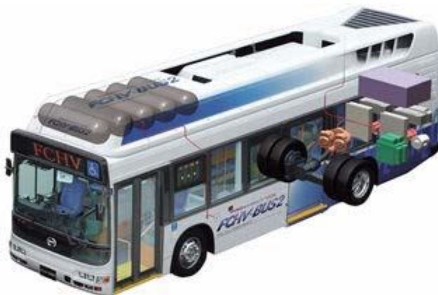
Figure 3 – Schéma du FCHV-BUS2 (2002)