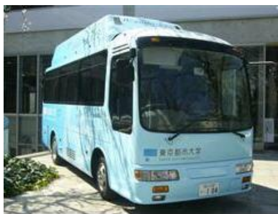
Figure 8 – Hino Motors - Le prototype de l'Université de Tokyo

En avril 2009, l'Université de Tokyo et le constructeur Hino Motors , ont présenté un minibus à pile à combustible ; son autonomie était voisine de 200 km (Fig. 8).