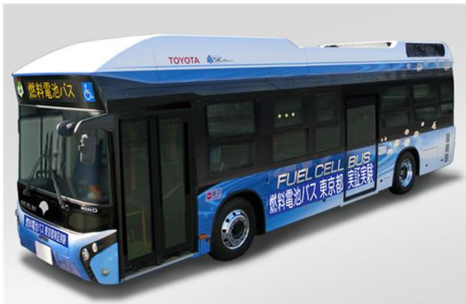
Figure 6 - Le FC BUS V2H (2015)

- En octobre 2017, Toyota a présenté son concept Sora 3 (cf. Fig. 7) qu'il souhaite commercialiser en 2018 et qui sera le modèle construit en 100 ex. pour les Jeux de 2020. Ses caractéristiques sont très voisines de celles du FC Bus V2H.