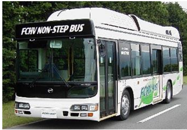
Figure 1 – Le prototype FCHV-BUS1 (2001)