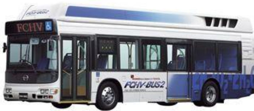
Figure 2 – Le bus FCHV-BUS2 (2002)